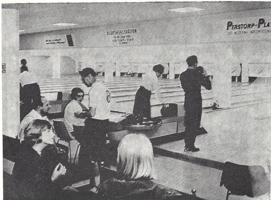
Östercentrum, hvor verdensmesterskaberne sandsynligvis skal holdes. Hallen ligger i Malmö og er med sine 44 baner den største i Europa.

Det store stævne holdes næste år antagelig i Malmö