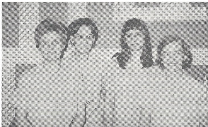
Lady Strikes damer, der suverænt vant det jyske mesterskab.

Listen over de bedste jyske bowlere inden danmarksmesterskaberne i Århus er som følger. Nærmere kommentarer behøver man vist ikke at knytte til listen denne gang. Der er ikke sket store forskydninger, og det er vel også begrænset, hvor store forskydninger, der vil ske, inden sæsonens afslutning.