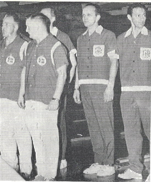
n dækker det danske. nissen.