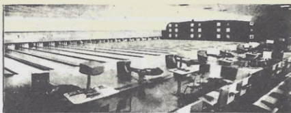
Starlite Bowling Center, Michigan, USA