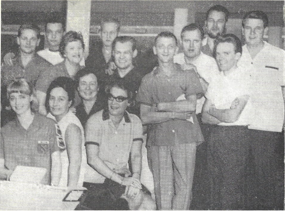
Smil på læben hos de danske deltagere i de nordiske mesterskaber i Oslo, - det må have været før stævnet ...