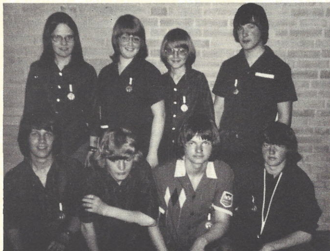
Her er Hernings unge talentfulde juniorbyhold

Hernings juniorspillere var det eneste lyspunkt da returkampen blev spillet i Viborg den 28. maj - de vandt en kæmpesejr og spillede med et snit på 152 mod Viborgs mere beskedne 142.