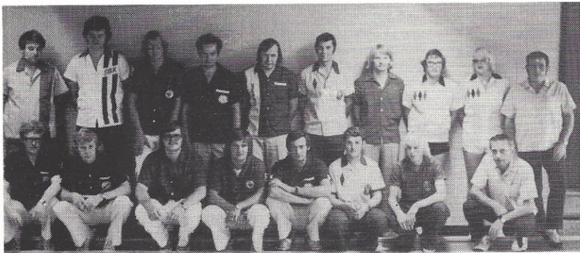
Sidste års deltager i finalen i AMAGER DOUBLE.