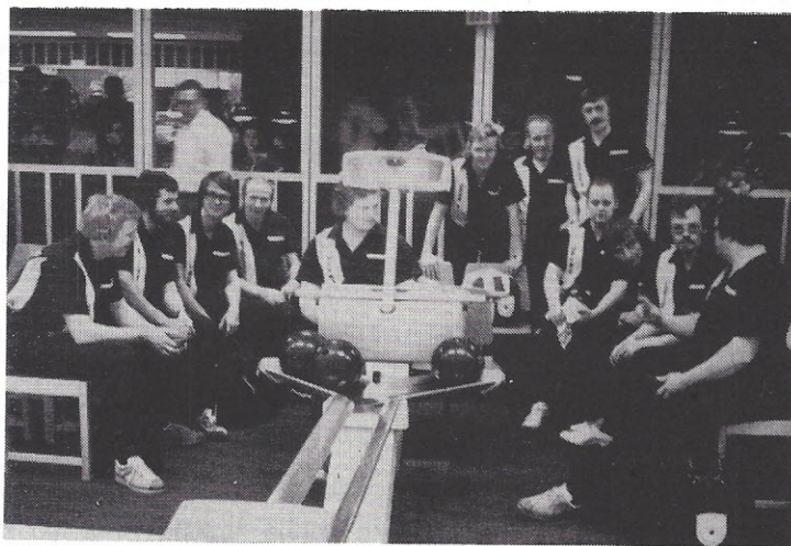
Vikings mandskab puster ud efter finalen i cupturneringen - se også side 3