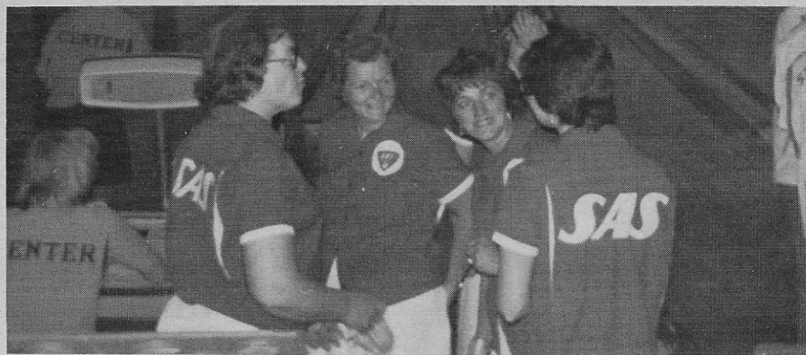
SAS-damerne var lige i humør til at spille en god finale.