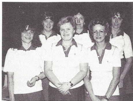
Dameholdet fra KBK 1940 Vindere af damernes serie 2A.