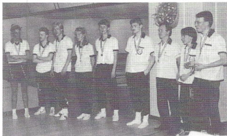
Vindere af Ungsenior 1 og 2 Jackpot og BK 77