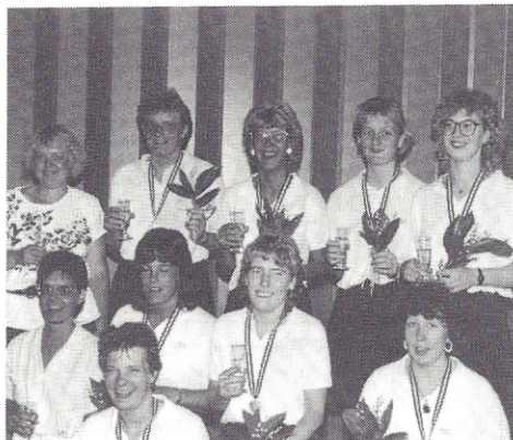
Vindere af Anden Division: SUNDBY