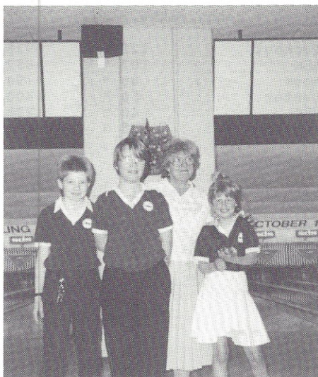
Vindere af forårsturneringen for ungdom. BK Hook