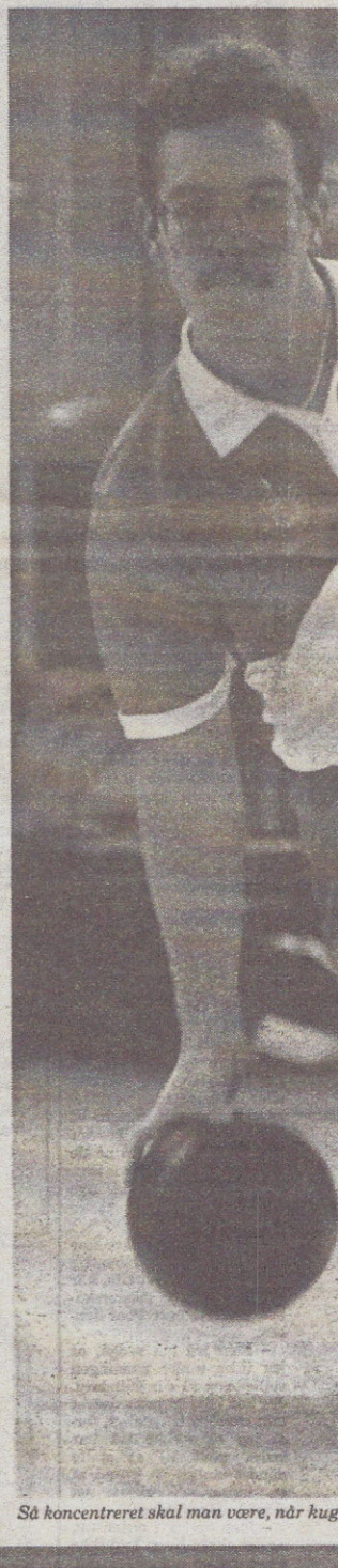
Så koncentreret skal man være, når kugle

- Et sådan pointtal kan måske udløse en medalje ved NM, siger han. Måske kan meget mindre gøre det. Hvem ved? Jeg håber bare, at min form passer på dagen.