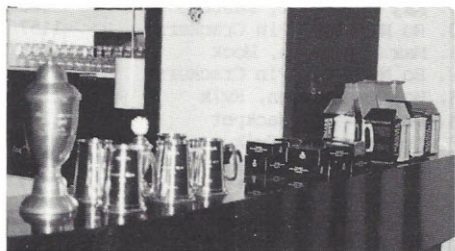
POKALERNE VI SPILLEDE OM