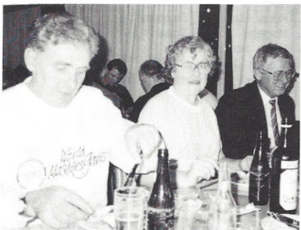
GOD STEMNING VED BANKETTEN