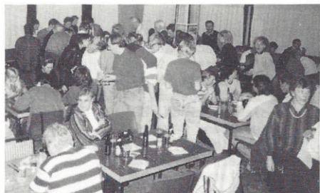
TRÆNGSEL OM MADBORDET