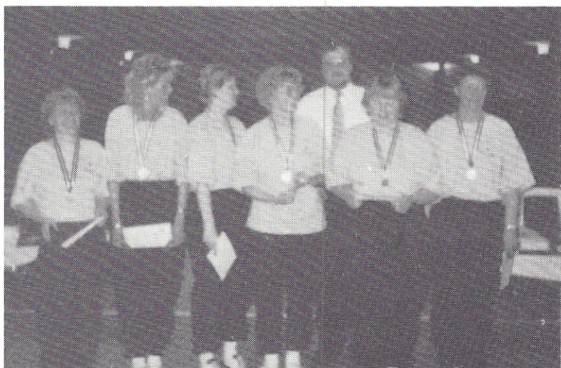
Vinder af Række B1 - KVIK