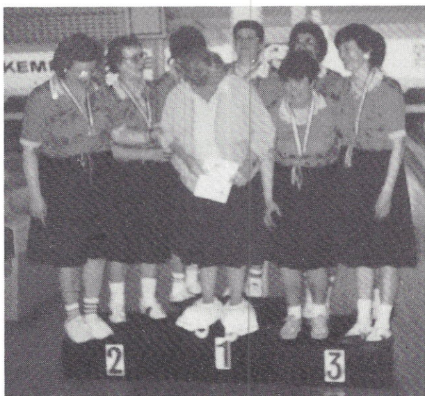
Vinder af 2. division, SPORVEJENE