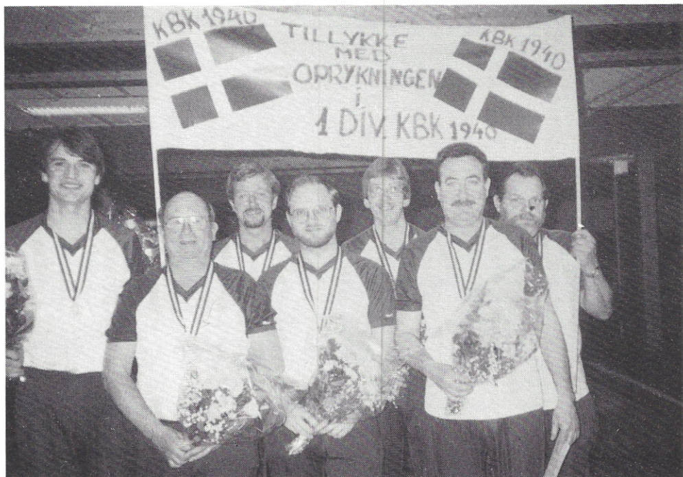
Vinder af 2. division KBK 1940