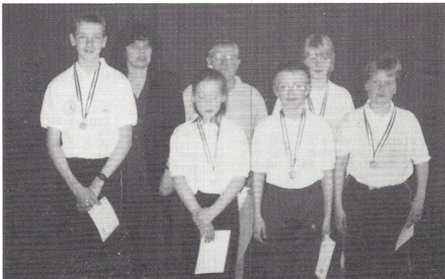
Vinder af Junior 3 - KREDS 2