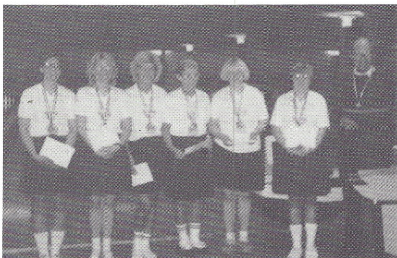
Vinder af serie 1A - SUNDBY