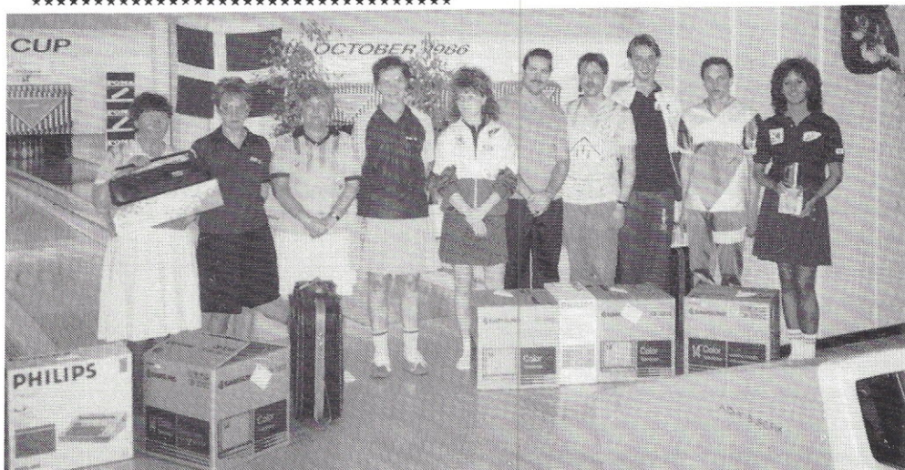
Prægtige præmier til dygtige bowlere. Jubilæumstævnet.