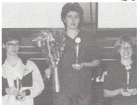
DAMER (incl. bonus):