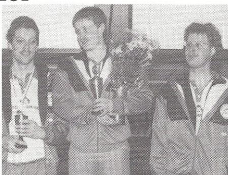
HERRER (incl. bonus)