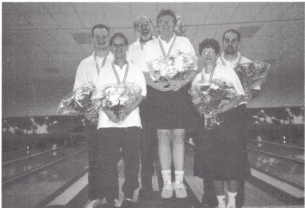
KM-MIX-VINDERNE, PLUS TOER OG TREER (bedre sent end aldrig)