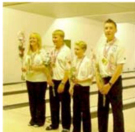
Stenhuset, vinder af Landsjunior