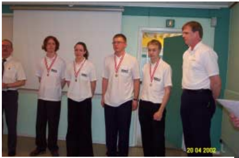
HBK 91 – pokalvinder Danmarksserien Ungdom