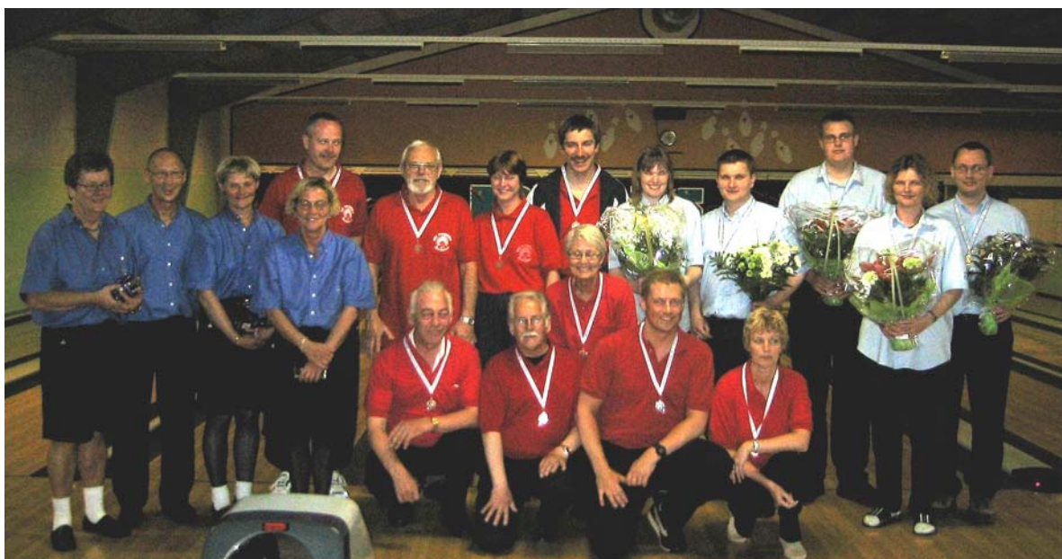
På billedet ovenover ses de deltagende hold