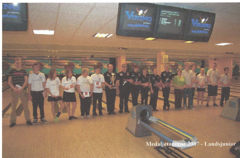
Medaljetagerne 2007 - Landsjunior