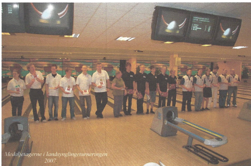
Medaljetagerne i landsynglingeturneringen 2007.