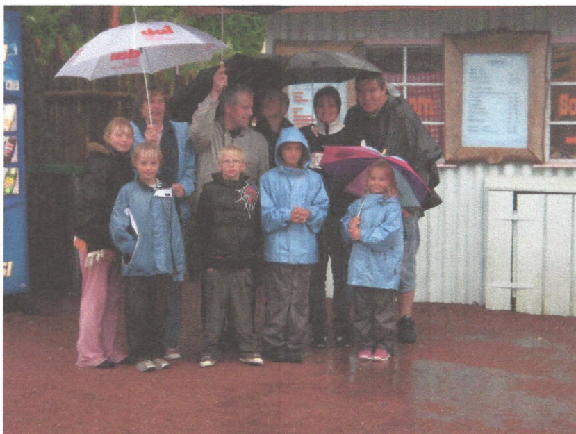
Ungdomsspillere og ledere fra Isefjord Bowling Club, der vandt den store konkurrence i Ungdommens år. Der er smil i ansigterne, trods vejrgudernes manglende velvilje.