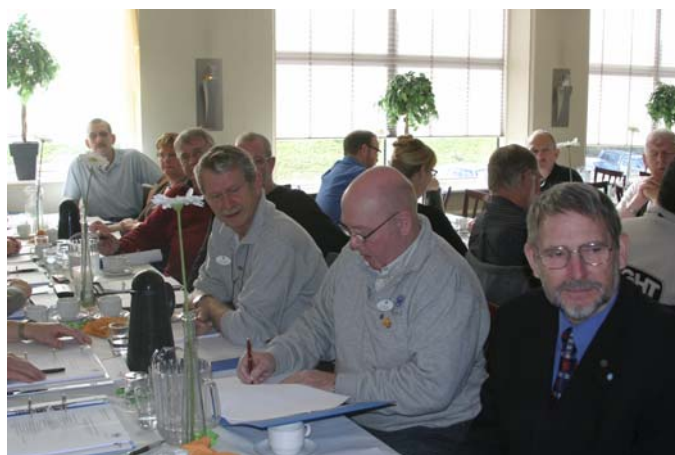
De øvrige billeder viser deltagerne i rep. mødet