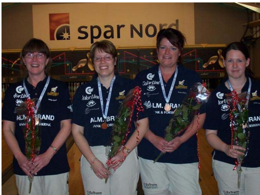
Billedet til venstre viser Bronzemedaljevinderne fra Hjørring BC 2