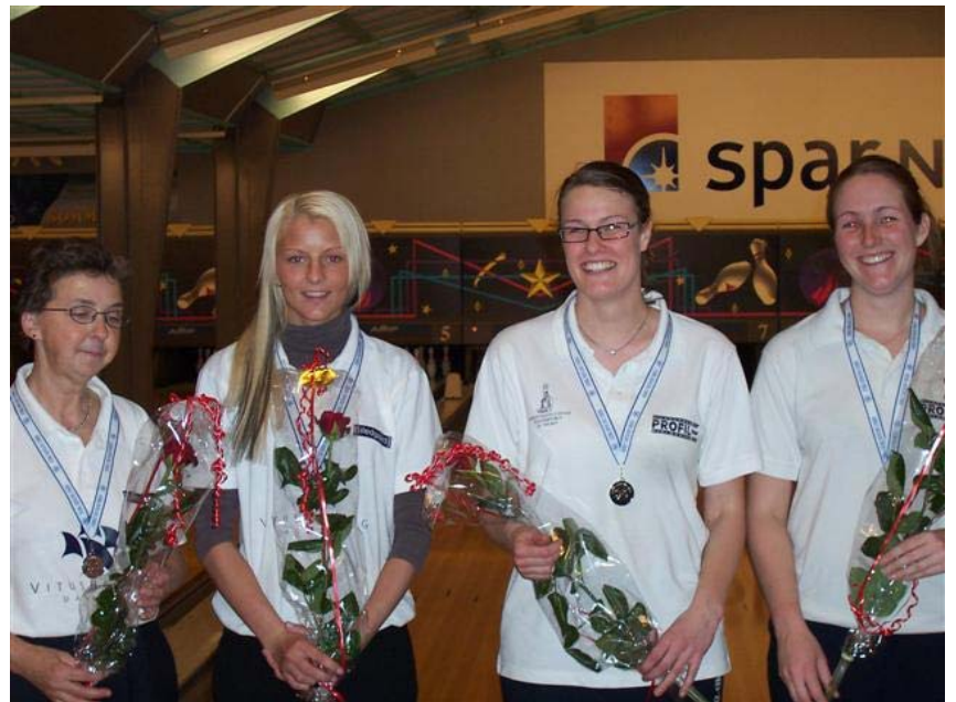
Billedet til højre viser sølvmedaljetagerne fra HBK 91 1