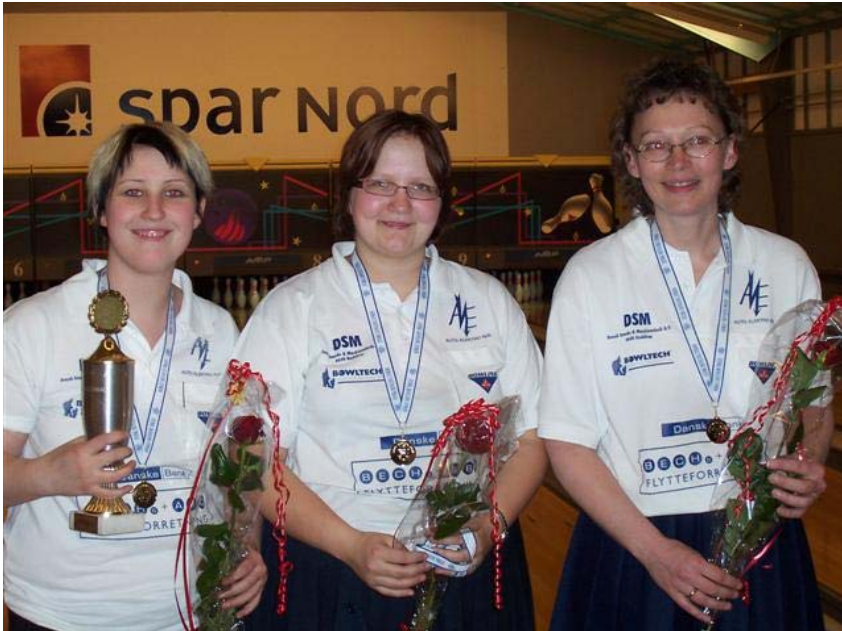
Billedet til venstre viser de glade guldmedaljevindere fra BK Trekanten KIF