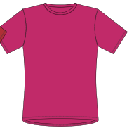
103 Peach Red

Farver til både herre og dame *) også til Junior