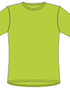
099 * Neon Yellow