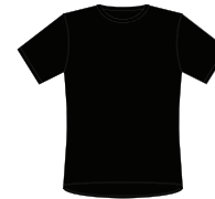
011 * Black

Farver til både herre og dame *) også til Junior