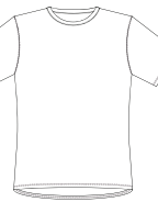
000 * White