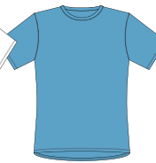
033 Light Blue