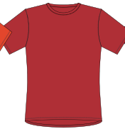
022 * Red