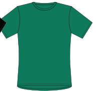
066 Grass Green