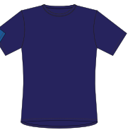
088 * Navy